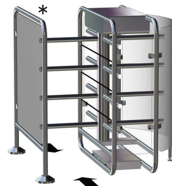
*Spurteiler / Geländerelement optional