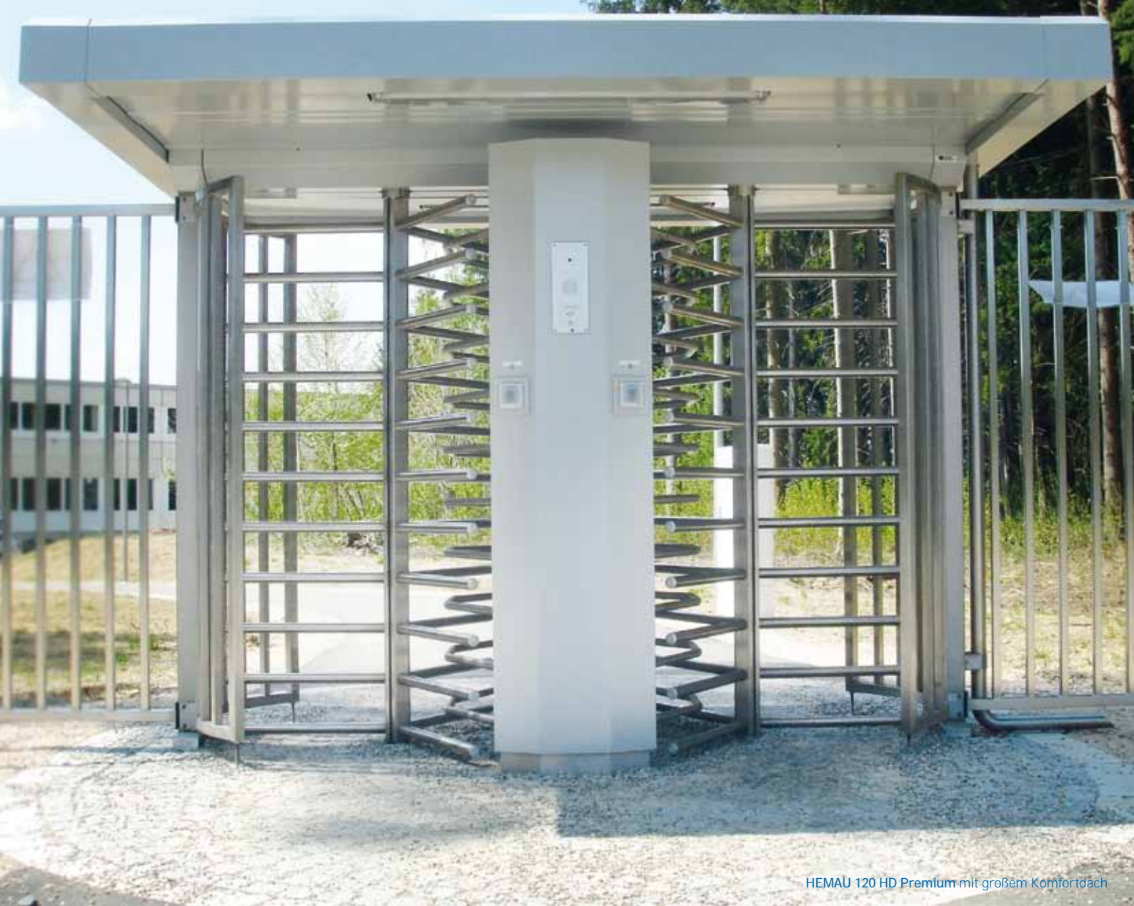
HEMAU 120 HD Premium mit großem Komfortdach