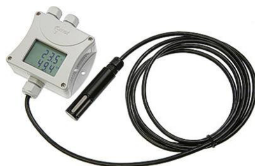
TPHB RS485 4m