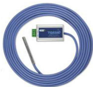
TP RS485 M