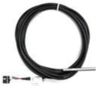
TP3 (3 m Anschlusskabel) TP30 (30 m Anschlusskabel)