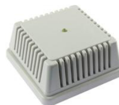
TP RS485 I