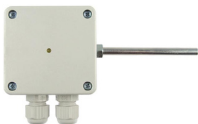
TP RS485 O